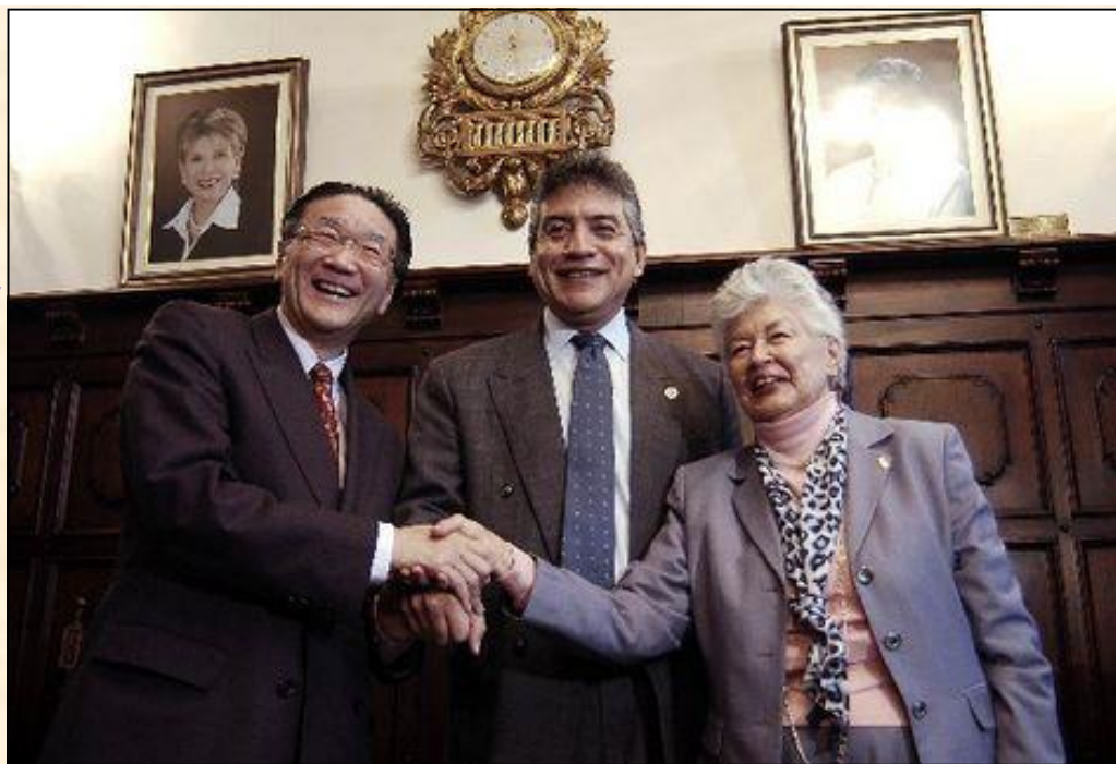
Personalidades que presidieron al acto, realizado en el Salón de los Ministros del Palacio Nacional de la Cultura.

EL jueves nueve de Diciembre de 2010 en el Palacio Nacional de la Cultura se realizó la firma del Contrato de Donación entre la Embajada de Japón en Guatemala y la Asociación Tikal para el Proyecto de Construcción e Implementación del Centro de Visitantes del Parque Kaminaljuyú.